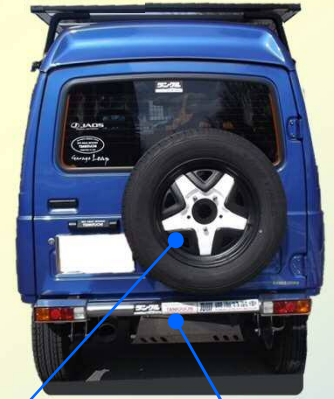
スペアタイヤ キャリアー