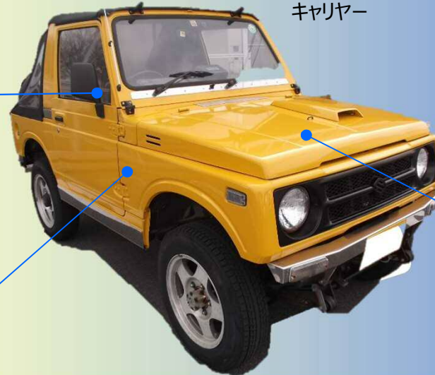
スペアタイヤ キャリア