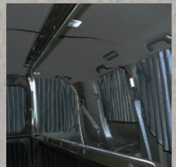
カーテン (オプション)