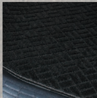
専用フロアマット (オプション)