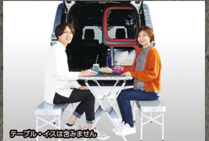
テーブル・イスは含みません

Photo：ZS 2WD[ガソリン車] ボディカラー：ホワイトパールクリスタルシャイン (070) 内装色はブラッドオレンジ&ブラックは設定色 (注文時に指定が必要です。)