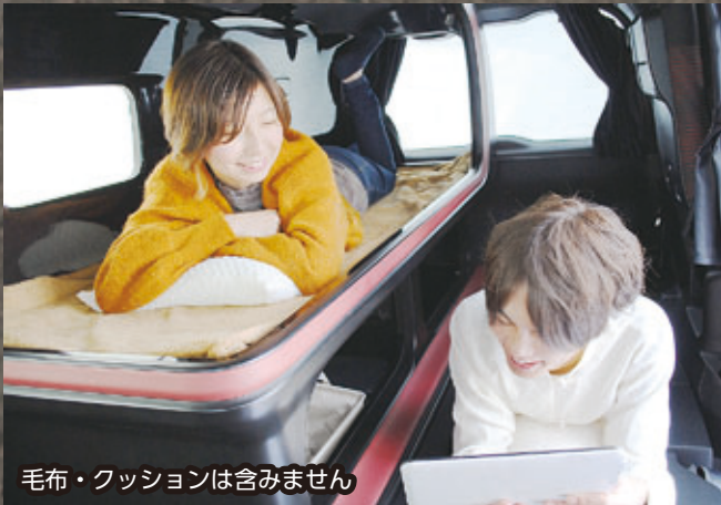
毛布・クッションは含みません