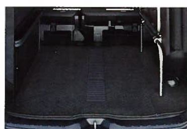
■フロアマット (専用)

■お問い合わせは、お近くのエスクエア取り扱い販売店または下記の東海特装車へ ●本仕様ならびに装備は予告なく変更することがあります。●ボディカラーや内装色は撮影、印刷インキの関係で実際とは異なって見えることがあります。●このリーフレットの内容は、2015年2月現在のものです。