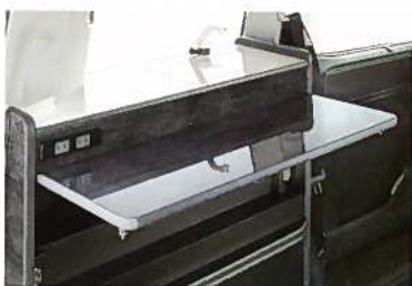
■折りたたみテーブル